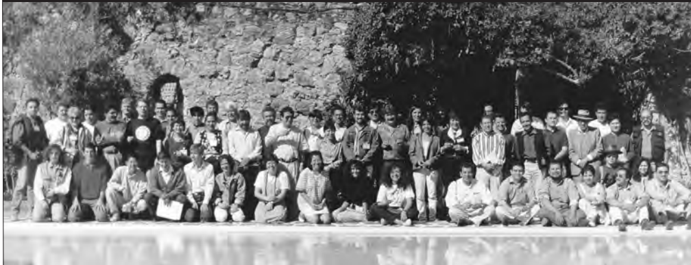
Reunión de Planeación Académica en Taxco, Guerrero.