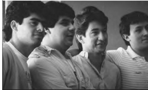
“Los Milusos” primera generación que duplica el ingreso de 30 a 60 alumnos.