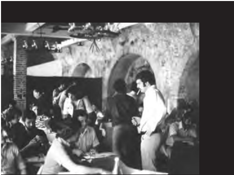
En Cocoyoc, Mor. se organizó la primera reunión de profesores y alumnos para revisar el Plan de Estudios.

consolida un intercambio de profesores a través del Consejo Británico y la UNAM, y la proyección de diseño industrial hacia el exterior por medio de exposiciones sigue acrecentándose. En los años 77 y 78 se presentan muestras de este tipo en León, Xalapa, Ciudad Universitaria y el Museo Tecnológico de la Comisión Federal de Electricidad, donde se monta una estupenda muestra de trabajos escolares que sirvió como preámbulo a la inauguración de las nuevas instalaciones a cargo del rector Soberón.